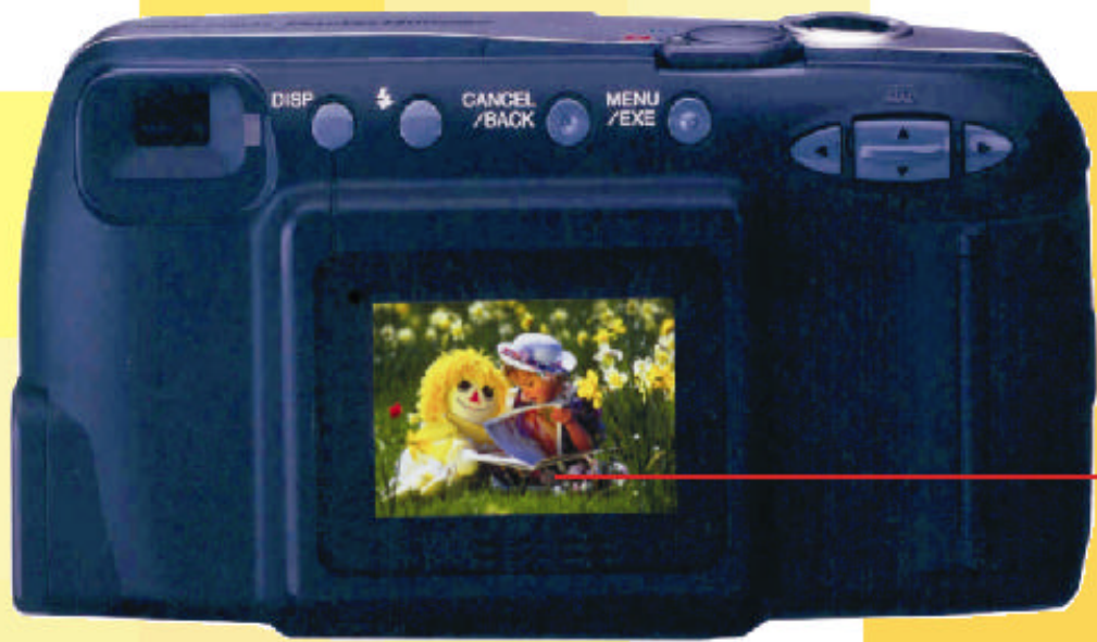
Pantalla de Cristal Líquido